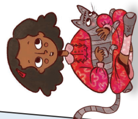
עיצוב: עדה ארזאל