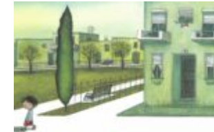
מאחורי הדלת יש שביל קבוצת גיל: גיל-לי אלון קוריאל

מאת: גיל-לי אלון קוריאל איורים: גיל-לי אלון קוריאל הוצאה: הקיבוץ המאוחד קבוצת גיל: גנים בוגרים