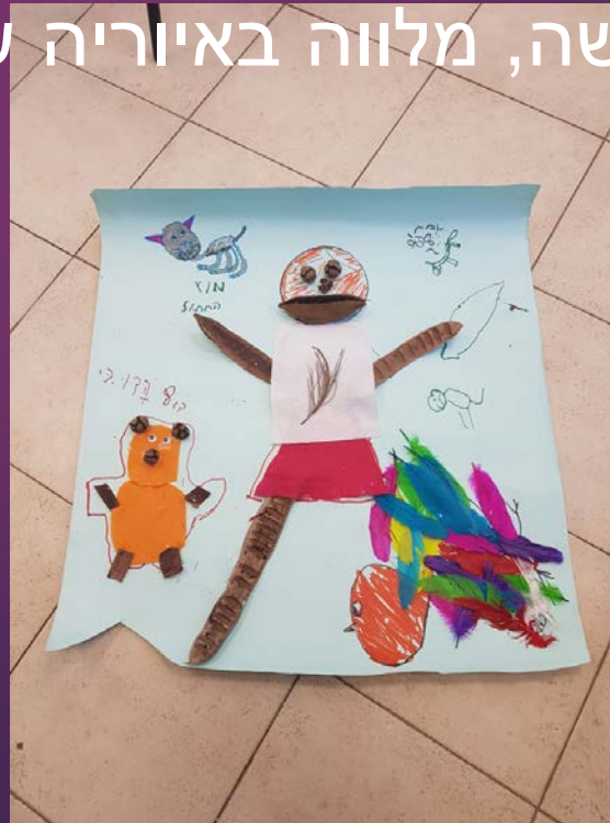
הבובה אלישבע מחומרים מהטבע. כתה ב1 ח.מ