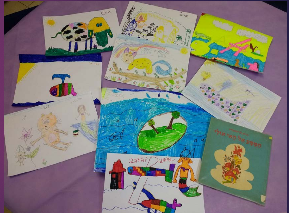
פעילות יצירה סביב הספר